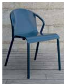
Design: Pedro Sottomayor