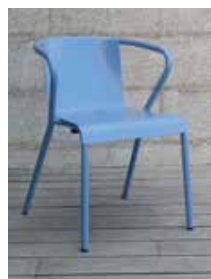
Design: Pedro Sottomayor